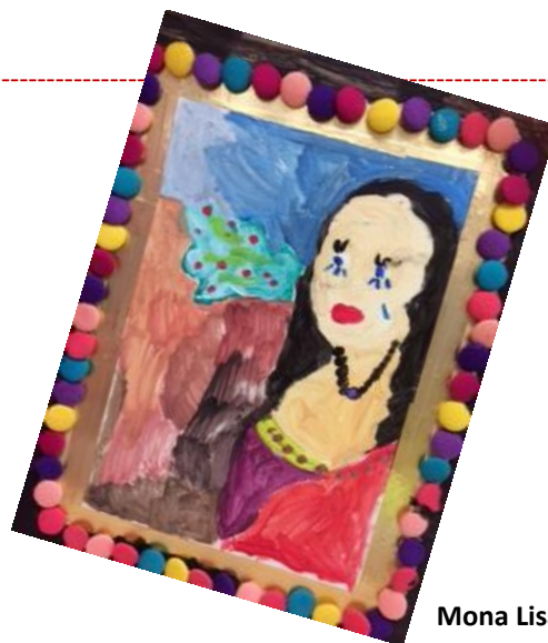
Mona Lisa (kleuters)

Niet vergeten: maandag 25 februari is een studiedag en zijn alle leerlingen vrij!