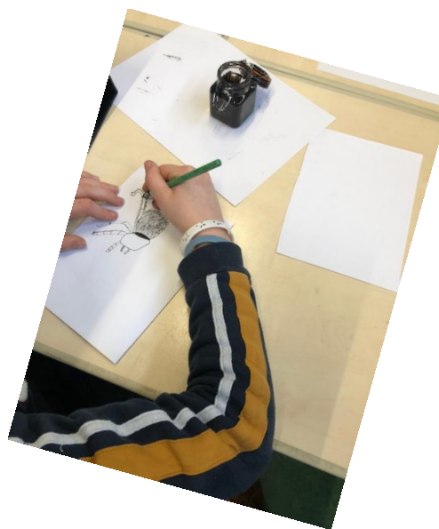
Techniek en materiaal: tekenen met Oost-Indische inkt/etsen als Rembrandt