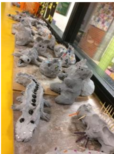
Boetseren 'Beestenboel' Teylers Museum